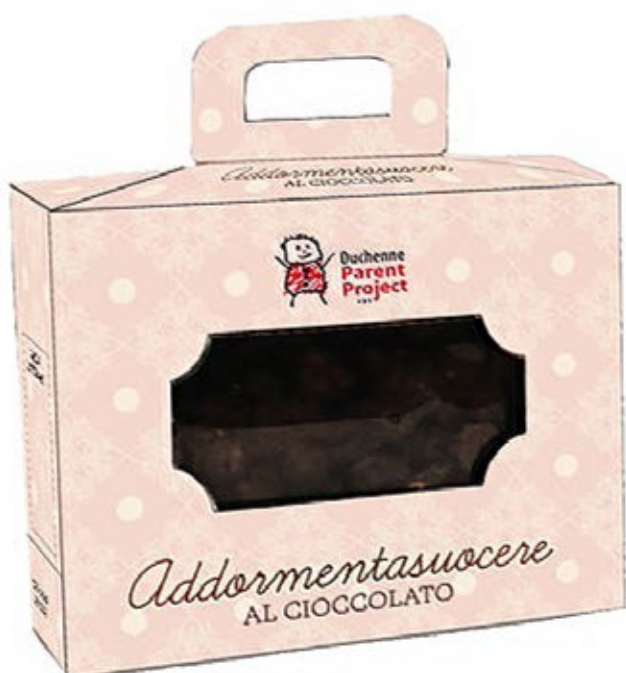
Addormentasuocere con nocciole ricorperte di cioccolato fondente da 250 g Donazione 10 euro