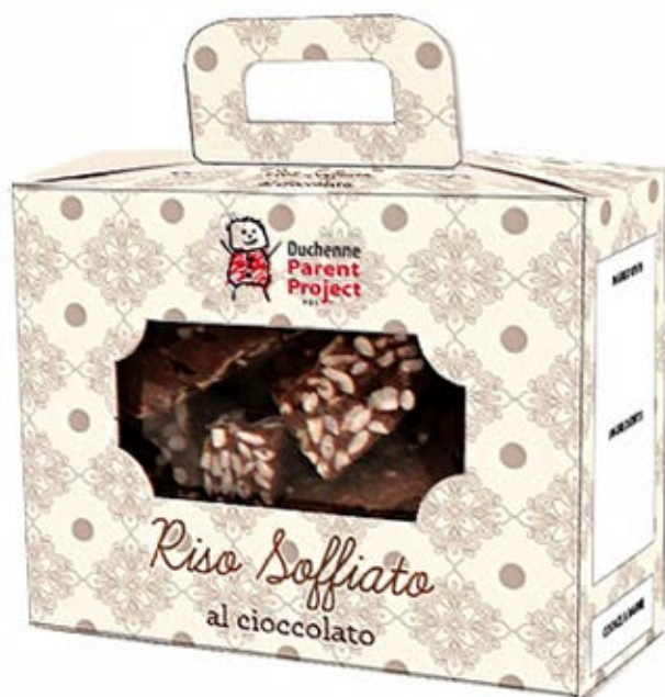
Riso soffiato ricoperto di cioccolato da 200 g Donazione 10 euro