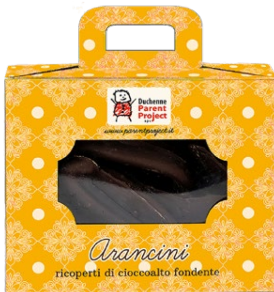
Arancini ricoperti di cioccolato fondente da 250 g Donazione 12 euro