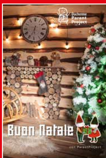
All I want for Christmas