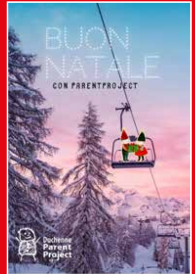
Verso l'infinito e oltre