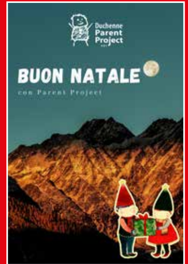
Fly me to the moon