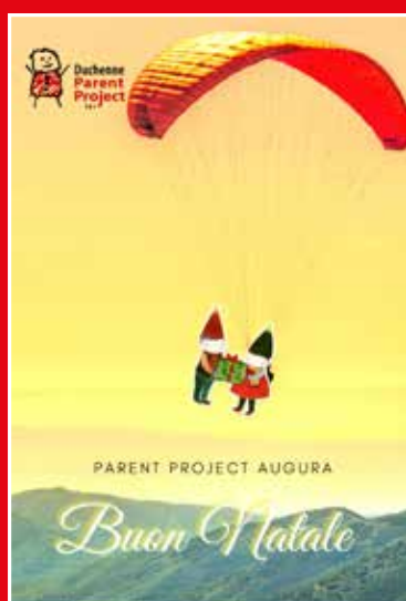
I believe I can fly