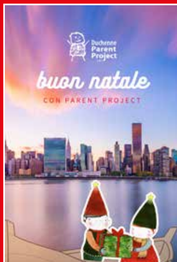
New York New York