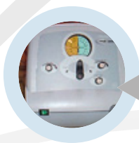
Macchina della tosse

tosse. Va utilizzata quando le tecniche di assistenza alla tosse manuali (la spinta sottodiaframmatica e il reclutamento polmonare) non sono sufficienti ad aumentare l'efficacia della tosse.